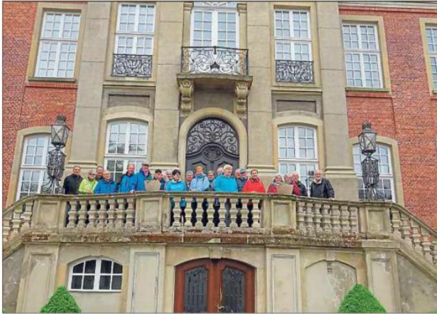
Die Gruppe „Fit ab 50“ hat bei ihrem Besuch in Ostbevern unter anderem Schloss Loburg besichtigt.